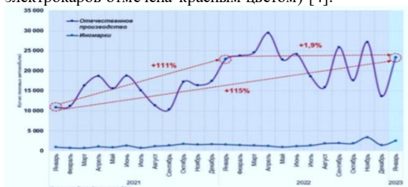
Рис. 1. Динамика продаж легкового транспорта, включая электромобили, на первичном рынке, 2021-2023 гг.