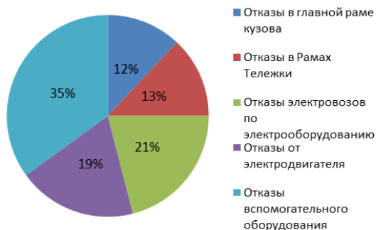
Рис. 1. Распределение отказов электровозов ВЛ80 и ЗВЛ80с по данным локомотивного депо “Узбекистан” и “Узбекистан темир йуллари” АО преимущественно в период 2017-2022 гг.

По результатам исследования были сделаны следующие общие выводы: